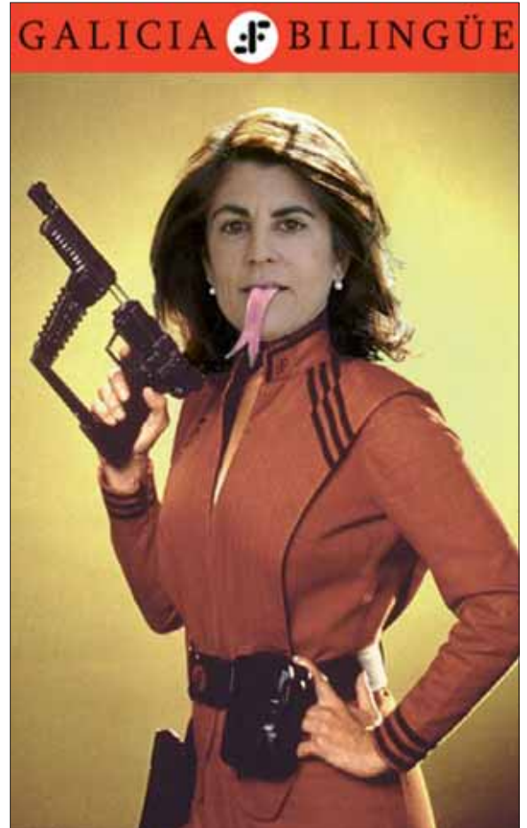
Gloria Lagartjo, presidenta de Galicia Bilingüe.