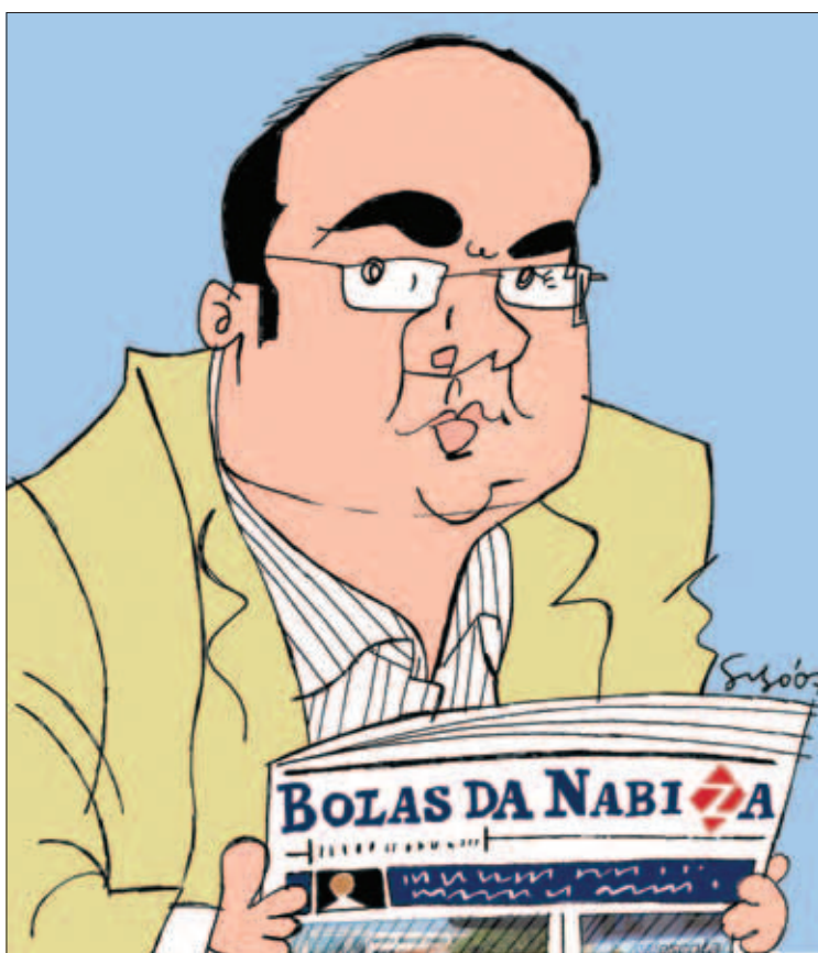
Rectificar é de sábios (e nom só): No controverso assunto este dos sobressoldos tanto BNG quanto NGZ cometeram um erro e 'sabiamente' tiveram de rectificar (Vid. NGZ Nº 58, p. 6)