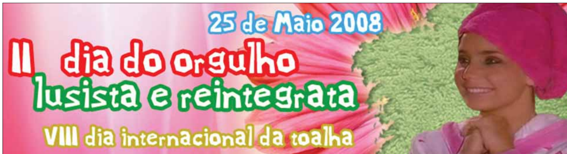
BANNER DO DdoOLeR'o8