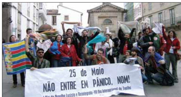
FOTO DE FAMÍLIA DdoOLeR'o7