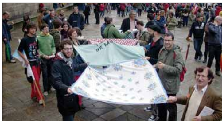
Toalhas DE MESA na manife d'A Mesa (18-MAI-o8)