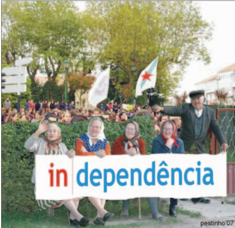
pestinho '07 PESTINHO +1