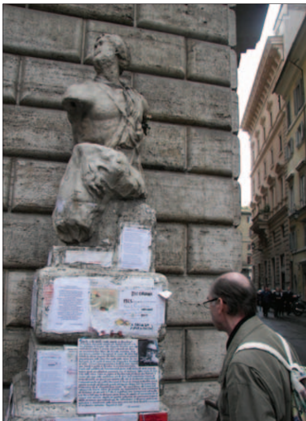
A ESTÁTUA DO PASQUIM, EM ROMA