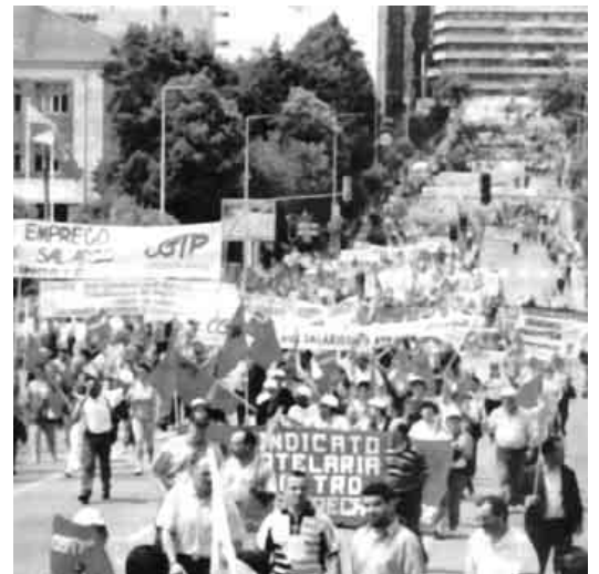
O apoio às organizações de esquerda cresceu com o descontentamento face aos governos da direita. No entanto, José Sócrates representa posições de centro.

Das eleições legislativas destacam-se três factos principais: a esmagadora derrota dos partidos da direita, a conquista da primeira maioria absoluta pelo Partido Socialista e o notável crescimento do Bloco de Esquerda, que praticamente triplicou a sua votação em seis anos.