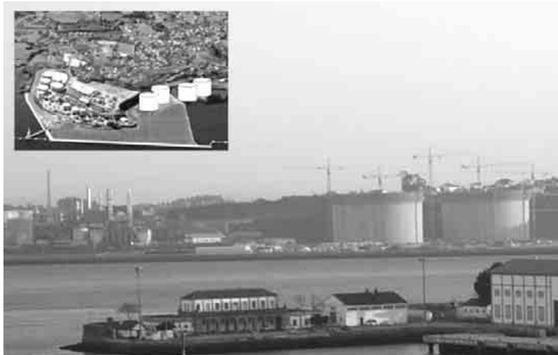
Visão geral dos dous tanques já levantados e parte do complexo petro-químico. Na parte superior esquerda vemos o aspecto de Ponta Promontório, incluindo os dous novos tanques previstos e as demais empresas já instaladas.

O projecto está rodeado por "muros de silêncio administrativo e mediático", como dixeram o falecido José Gabeiras. E o ditame da ocultação atinge pessoas próximas do trabalho de trasladação dos restos, que se recusaram a fazer declarações perante as consultas deste jornal e manifestaram estarem pressionadas, remetendo-