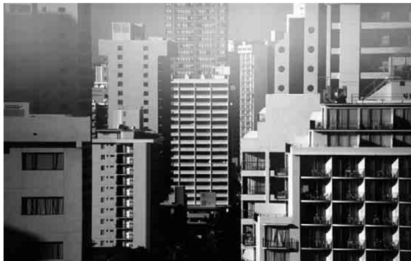
O ar está-se a tornar irrespirável, por efeito da poluição, nas grandes cidades europeias