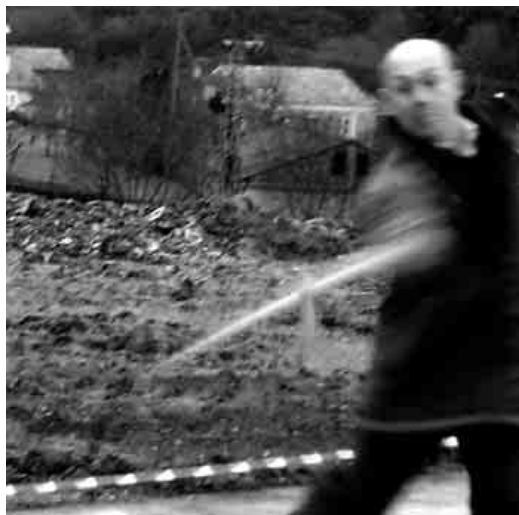
A bilharda é um dos jogos populares galegos que se persegue recuperar

Para além dos flashes e das câmaras dos meios de comunicação encontramos tentativas e atitudes muito positivas para dotarmos a rede desportiva nacional de umha infra-estrutura por enquanto deficitária. Referimo-nos a iniciativas como as do Centro de Interpretaçom de Jogos Populares 'O Palao' de