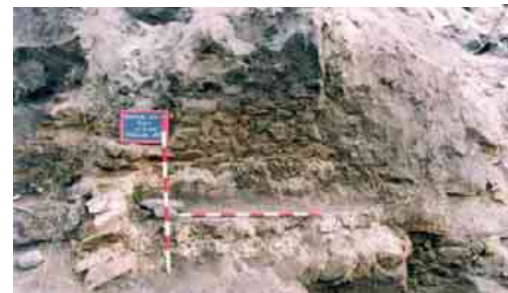
Profissionais da arqueologia acusam o Laboratório de Arqueologia e Formas Culturais de exercer competência desleal.