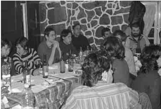
A Jornada de convívio tivo lugar em Fevereiro