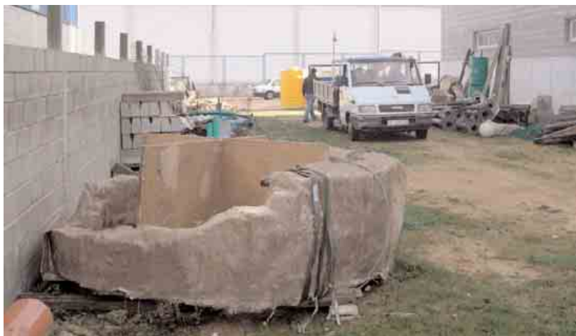
Estado em que se encontra actualmente o forno oleiro de época romana encontrado nas escavações. Trata-se do único exemplar deste tipo localizado na Galiza.