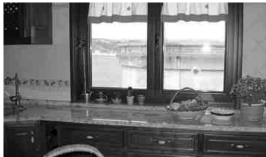
As instalações de Reganosa estão muito próximas das casas de Mugardos.

DIVERSOS ESPECIALISTAS QUE ANALISÁROM OS RESTOS ROMANOS DE CALDOVAL CONCLUÍROM QUE ERA PRECISO ESTUDAR E INVENTARIAR AS PEÇAS DURANTE TRÊS ANOS ANTES DA SUA ENTRADA NUM MUSEU. TRATA-SE DE UM CONJUNTO ARQUEOLÓGICO COM VESTÍGIOS DE UMHA VILA ROMANA DEDICADA À PESCA ENTRES OS SÉCULOS II E V A.C., SITUADOS JUNTO AO CASTRO DE MEÁ E OS RESTOS TAMBÉM ROMANOS DE SANTA LUZIA. O FUNCIONAMENTO CONJUNTO DAS INSTALAÇÕES INDUSTRIAIS PROVOCARIA A ENTRADA DE MAIS DE CEM NAVIOS DE 135.000 M 3 DE GÁS NATURAL LIQUEFEITO CADA ANO.