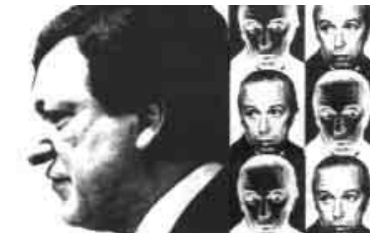
Santana Lopes, como Primeiro Ministro designado por Durão Barroso, acabou por desacreditar por completo à direita portuguesa. Foi castigado pelo eleitorado.

É UM CASO ÚNICO EM PORTUGAL DE AFIRMAÇÃO DE UMA FORÇA POLÍTICA NOVA QUE CONSEGUE ROMPER A TENDÊNCIA PARA A BIPOLARIZAÇÃO. FORMADO HÁ ESCASSOS SEIS ANOS, O BE É PORVENTURA A MAIOR REVELAÇÃO DESTAS ELEIÇÕES.