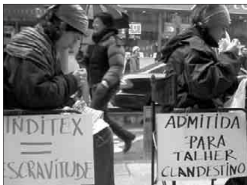
Mulheres Transgredindo frente umha loja compostelana de INDITEX / M.T.

Superior da Justiça da Galiza, para que aqueles homens que exerçam a violência contra as mulheres e tenham sido condenados a menos de dois anos de prisão podam substituir esta condena por "cursos ou jornadas de reeducação", segundo declarou o conselheiro.