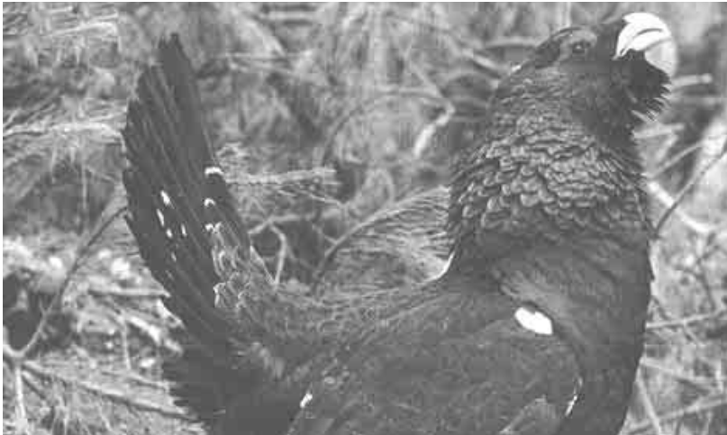
Em finais do século XX só ficavam "pitas-do-monte", como ali são conhecidas, na Serra dos Ancares

Sulcam os céus as primeiras sandorinhas e as flores cobrem salgueiros e mimosas. A Primavera já está aqui. Uma Primavera que nas últimas décadas vem adiantando progressivamente a sua chegada devido ao aquecimento global, consequência da intensificação do efeito de estufa. Foi em 1896, em plena Revolução Industrial, quando um químico sueco, Arrhenius, intuiu que a queima dos combustíveis fósseis haveria de provocar uma mudança climática. Mas esta subida das temperaturas não era contemplada como algo negativo por um escandinavo do século XIX. Pensava Arrhenius que "por influência do percentual crescente de CO2 na atmosfera, temos esperança de desfrutar de épocas com climas melhores e mais estáveis, sobretudo nas regiões mais frias da Terra". Hoje, no entanto, parece existir um consenso quase geral na comunidade científica sobre os efeitos catastróficos do aquecimento do Planeta: aumento no