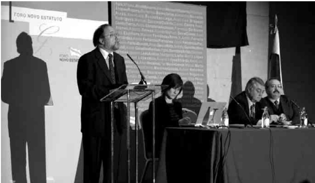
A equipa da qual o BNG solicitou as bases para o novo Estatuto é composta por diferentes representantes da vida política e académica